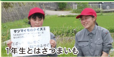
1年生とはさつまいも