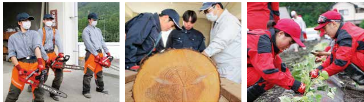
育林専攻班 樹木の育苗から間伐・枝打ち・伐倒・造材など山での仕事を身に付けます。 木材加工専攻班 地域資源を利用した木材家具や木工製品を自ら設計・製材・組立します。 園芸専攻班 冷涼な気候を生かした美味しい高原野菜や四季の花を育てます。