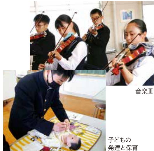
音楽Ⅲ 子どもの発達と保育