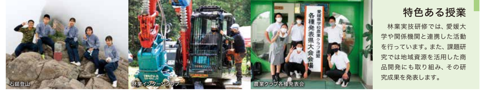
石鎚登山 林業インターンシップ 農業クラブ各種発表会

森林環境科は、森林環境や農業に関する科目を多く学びます。総合実習では、2年次から3つの専攻班に分かれ、より専門的な知識や技術を身に付けることができます。また、森林野外活動や木材デザインなどの学校設定科目があり、夏にはサマーキャンプや石鎚登山を行っています。