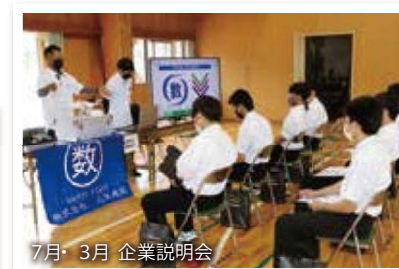
7月・3月 企業説明会