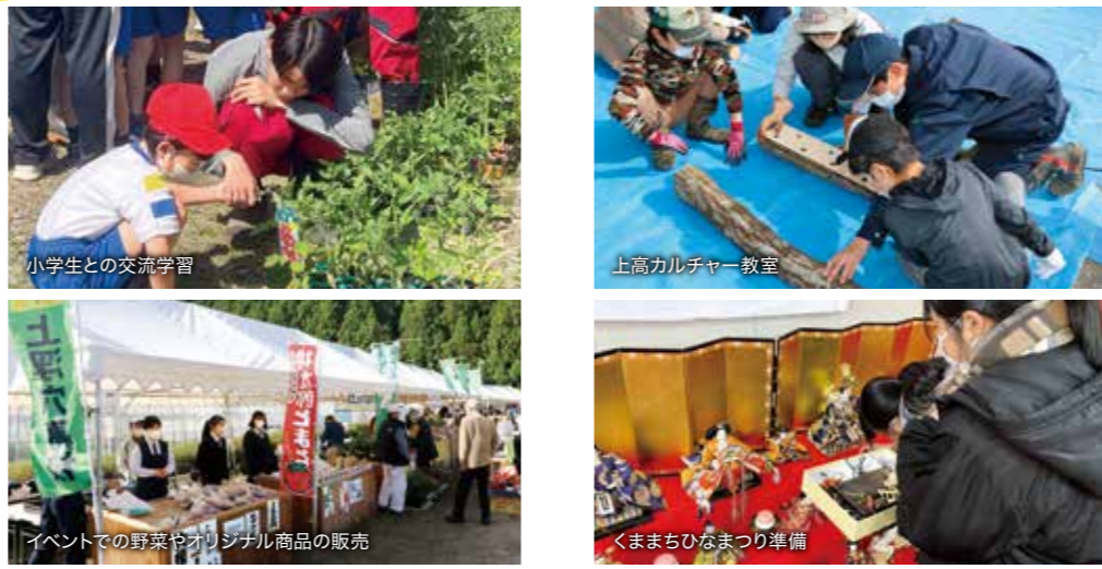
小学生との交流学習 上高カルチャー教室 イベントでの野菜や加工商品の販売 くままちひなまつり準備