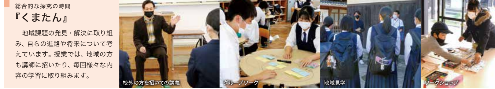
総合的な探究の時間 『くまたん』 地域課題の発見・解決に取り組み、自らの進路や将来について考えています。授業では、地域の方も講師に招いたり、毎回様々な内容の学習に取り組みます。 校外の方を招いての講義 グループワーク 地域見学 ワークショップ