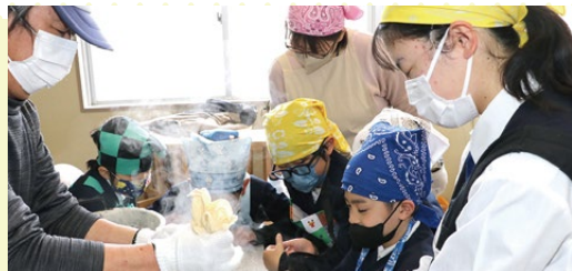
ライフデザイン部 久万幼稚園訪問

1年を通してたくさんの交流をしてきた生徒たち。お互い自然な笑顔で会話が弾みます。4月からは新しい学年で、また会いましょう。