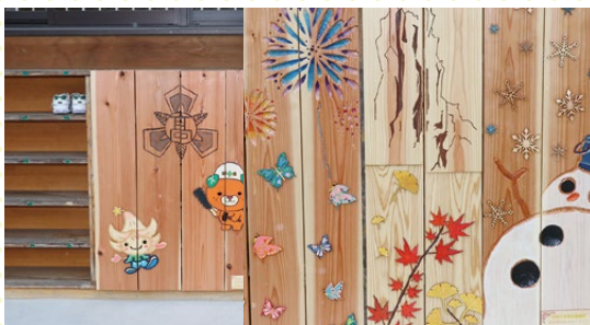
▲ 木工班卒業制作 体育館横下駄箱の雨除け ありがとう。大切に使用させていただきます。