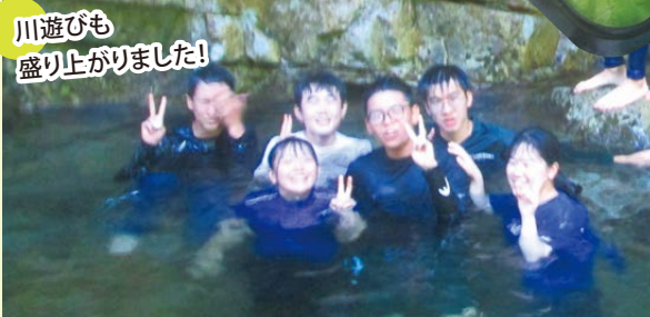
川遊びも盛り上がりました!

下山後のお楽しみ! メスティンを使った 「アウトドア飯」に疲れも 一気に吹き飛びます!