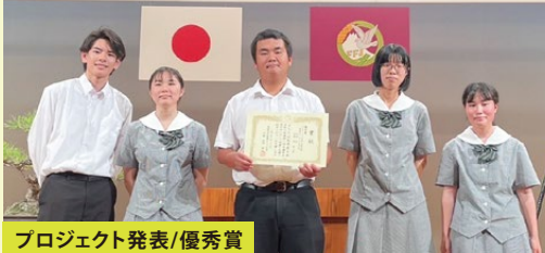
プロジェクト発表/優秀賞