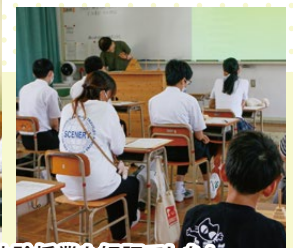
各先生が趣向をこらした体験授業も好評でした!