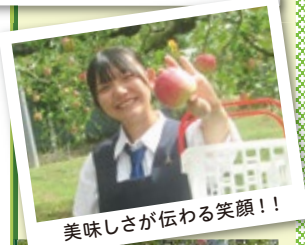
美味しさが伝わる笑顔!!