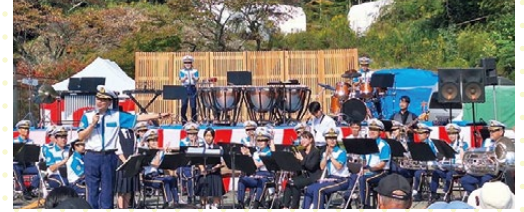
吹奏楽部は愛媛県警察音楽隊と一緒に演奏を披露