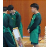
木育キャラバンボランティア