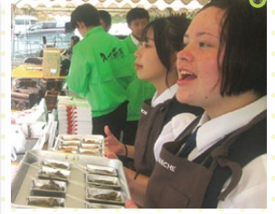
上高レトルトの試食販売