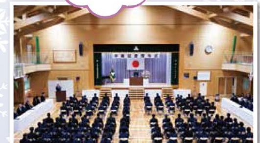
3月 卒業証書授与式

地域の期待に応えるため、高校生として、徳・知・体の調和のある人間づくりを目指すとともに、生徒一人一人をみつめ、その資質・個性に応じた教育を行う。