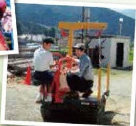
7月 中学生一日 体験入学