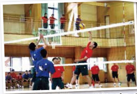
7月・12月 グループマッチ