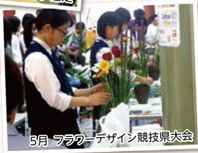
5月 フラワーデザイン競技県大会