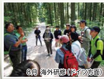
8月 海外研修(ドイツ方面)