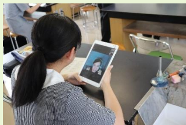
オンライン英会話!

また、8/6(木)には森林環境科2年生の生徒がオンライン開催の就農啓発研修会に参加し、他の学校の生徒と活発に意見交換をしたり、様々な農業法人や研修施設の方々のお話を聞いたりしました。8/29(土)には「トビタテ! 四国のローカルSDGs」に普通科3年生と1年生の生徒が参加し、発表やワークショップに取り組みました。このように新型コロナウイルス感染症にめげず、インターネットを活用して様々な活動をしています。