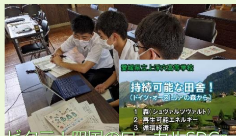
トビタテ! 四国のローカルSDGs