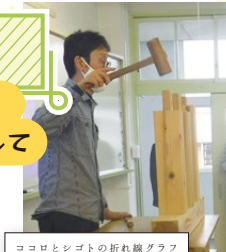
ココロとシゴトの折れ線グラフ

今までの授業をちょっと振り返り、改めて身近なSDGsや地元の良さなど、考えてもらえたらと思います。