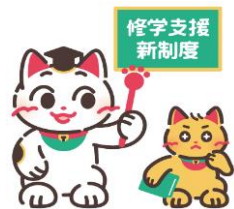
「高等教育の修学支援」公式キャラクター 【まねこ先生（左）とまなびーニャ（右）】

より多くの学生・生徒やその保護者の方々に、本制度のことを知っていただけるよう、 文部科学省と日本学生支援機構において次のコンテンツを用意しています。是非ともご覧いただければと思います。