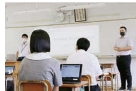
英語コミュニケーションⅡ