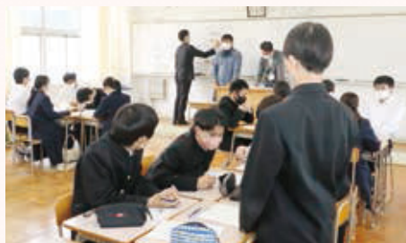
町職員との意見交換

「くまたん」とは、 くま 久万高原町 たん を探究する活動です。地域課題の発見・解決に取り組み、自らの進路や将来について考えます。授業では、地域の方々が講師となり、毎回様々な内容の学習に取り組んでいます。