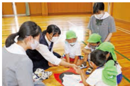
子どもの発達と保育