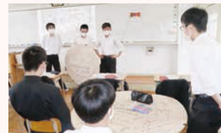
グループ別研究発表