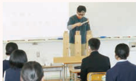
建築士による講義