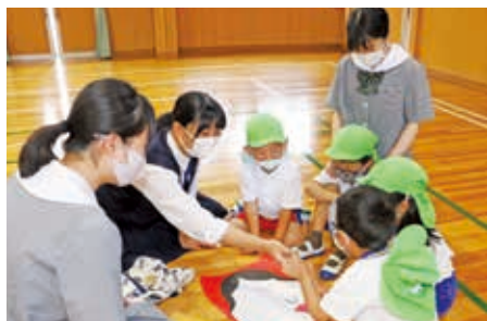
子どもの発達と保育