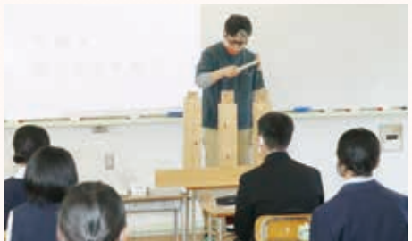
建築士による講義