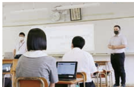
英語コミュニケーションⅡ