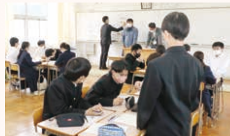
町職員との意見交換

「くまたん」とは、くまもと県久万高原町を探究する活動です。地域課題の発見・解決に取り組み、自らの進路や将来について考えます。授業では、地域の方々が講師となり、毎回様々な内容の学習に取り組んでいます。