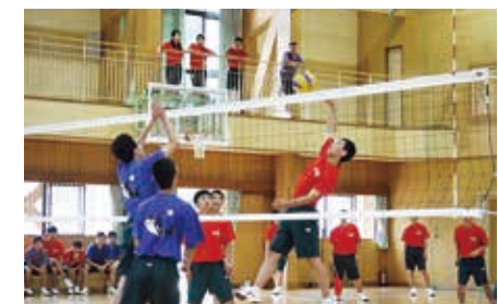
7月・12月 グループマッチ