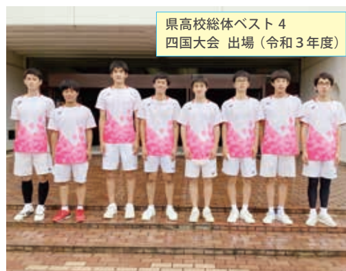
県高校総体ベスト4 四国大会 出場(令和3年度)