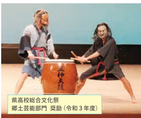
県高校総合文化祭 郷土芸能部門 奨励(令和3年度)