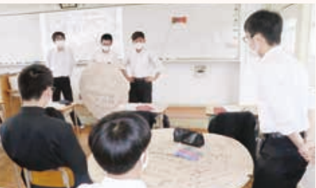
グループ別研究発表