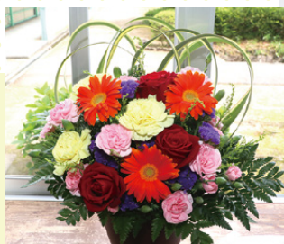
2-1 玉置 花琴 優秀賞

令和4年度愛媛県学校農業クラブ連盟フラワーデザイン競技県大会において、2名の生徒が優秀賞をいただきました。